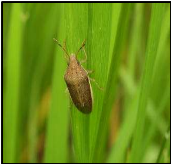
イネカメムシ（大型）