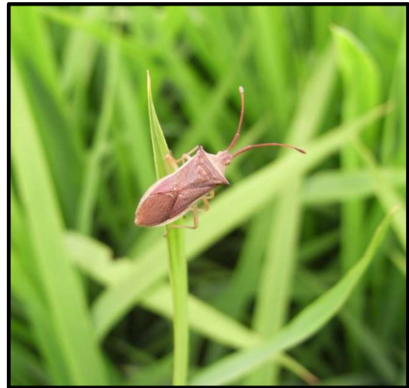
ホソハリカメムシ(大型)