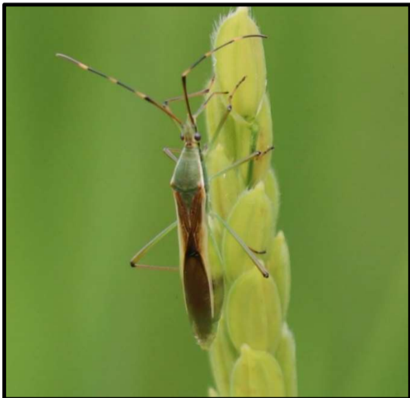
クモハリカメムシ（大型）