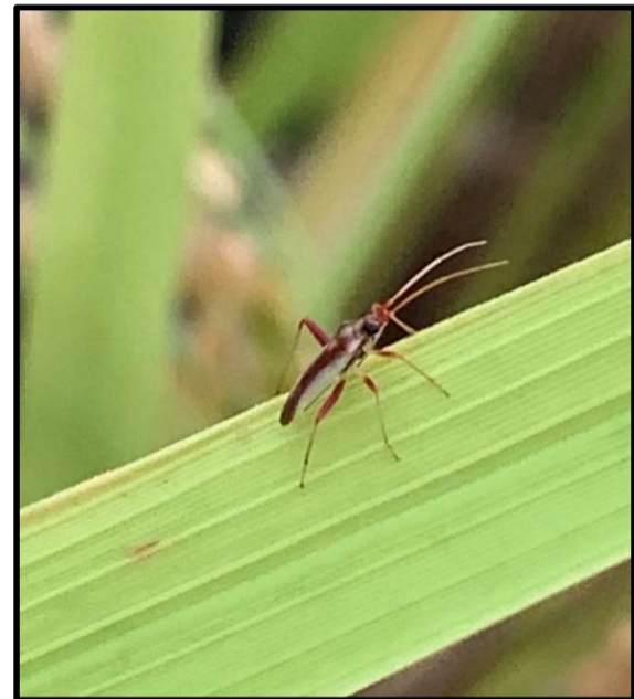
アカスジカスミカメ（小型）